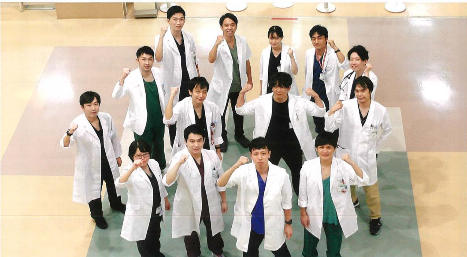
臨床研修医（2年・1年）